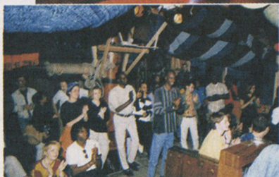
La Guinguette Pirate.

Cette demande n'est pas nouvelle en soi, c'est l'amplitude de la réponse qui laisse songeur. Il n'est plus un café où l'on ne parle philo (le premier fut le Café des Phares), littérature (La Maroquinerie, les soirées des Livreurs Publics), écolo (le Lavoir Moderne Parisien). Combien de bistrotts donnent des pièces de théâtre, tandis que les troupes qui jouent dans les bars se multiplient (Cie de l'Embardé, Les Ferrailleurs, Cabaret de Sulo...)? Il n'est plus un restaurant qui n'organise ses accrochages de tableaux - il existe même un restaurant-galerie, le Pictural Café. Nombre d'entre eux organisent des concerts : le Réservoir, le China Club, la Flèche d'Or, et tant d'autres... Dans certains établissements, comme le Hollywood Savoy ou le Bar à Tapas du Club Med World, ce sont les serveurs et serveuses qui montent sur scène, créant ainsi une ambiance unique. Au Chicago Meat-