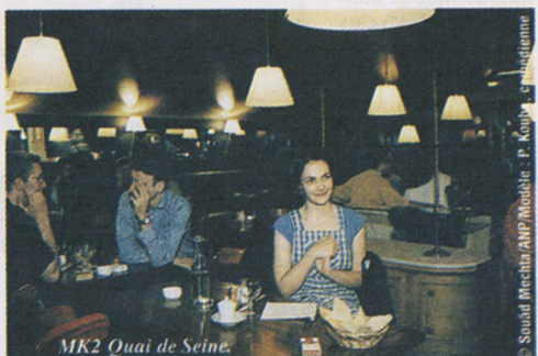
Mk2 Quai de Seine.

La liste est sans fin. Une chose est certaine : nous ne nous contentons plus de boire un verre ou de nous restaurer, il nous en faut plus. Nous sommes en demande de prétextes pour nous rencontrer, nous réclamons de l'art pour nous évader. Un art qui, pour le coup, sort de ses temples officiels pour descendre dans les rues et les boulevards de la capitale, comme s'il avait été étouffé trop longtemps. Une création qui ne supporterait plus les froides mises en scène des musées nationaux, théâtres contempo-